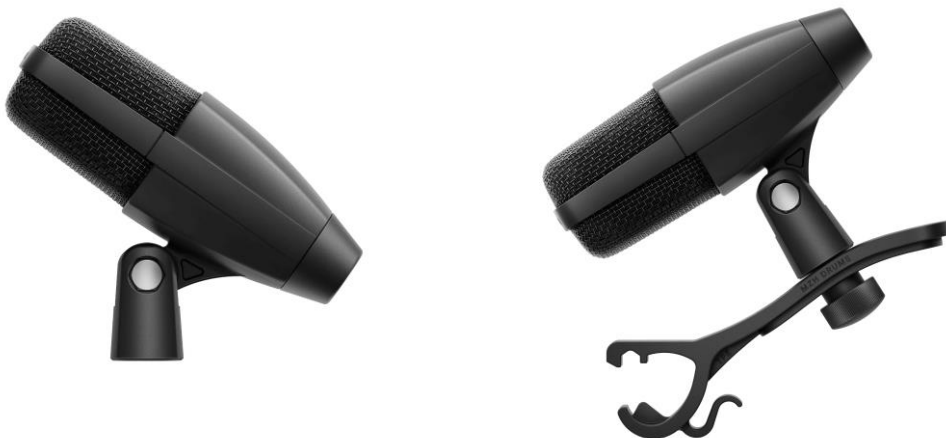
MD 421 Kompakt (kiri) dan MD 421 Kompakt untuk Drum, yang dilengkapi dengan tambahan drum clamp MZH

Jakarta, 15 Oktober 2024 - Banyak yang mengatakan bahwa jika Anda pernah mendengarkan musik, kemungkinan besar Anda pernah mendengar suara dari MD 421, mikrofon Sennheiser yang tampil dalam berbagai pertunjukan dan produksi yang telah meraih banyak penghargaan selama enam dekade terakhir. Kini, Sennheiser meluncurkan MD 421 Kompakt, mikrofon yang sangat serbaguna dan menghadirkan performa legendaris yang sama, namun dalam kemasan multiguna — termasuk klip pemasangan yang sepenuhnya didesain ulang. MD 421 Kompakt memiliki pola cardioid pick-up yang luar biasa, memberikan reproduksi suara yang jernih, baik dalam aplikasi suara untuk live maupun rekaman.