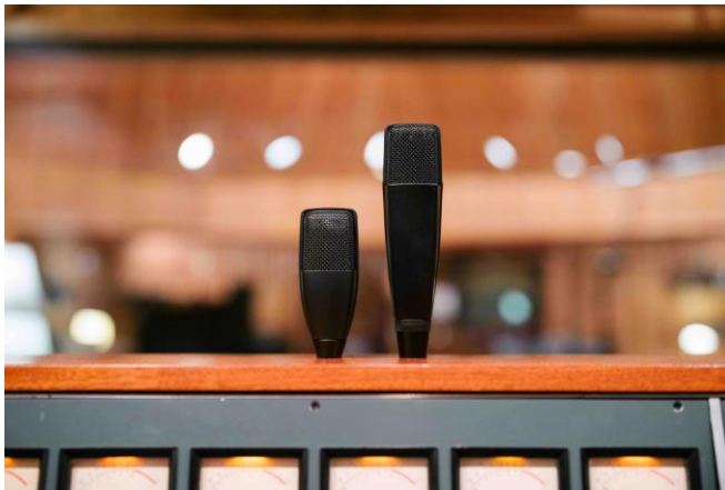
MD 421 Kompakt yang memiliki diafragma besar ini menawarkan suara legendaris yang sama seperti MD 421-II (kanan).